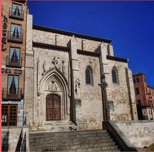
Iglesia de San Nicolás