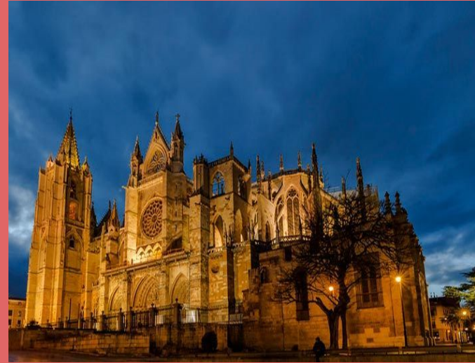
Catedral de León